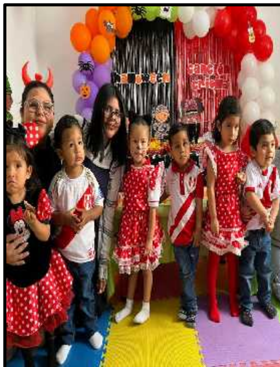
Imagen 73: Los estudiantes detectives celebrando este día especial como peruanos.