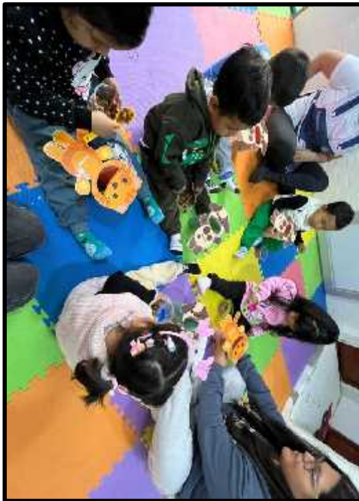
Imagen 30: Los estudiantes dándole de comer croquetas a nuestros gatitos y perritos.