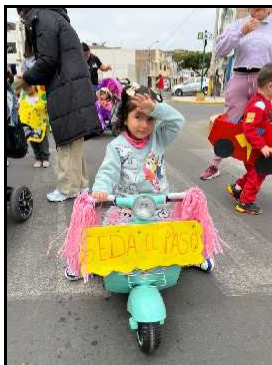
Imagen 28: Los estudiantes y sus papás concientizándose sobre la Educación Vial