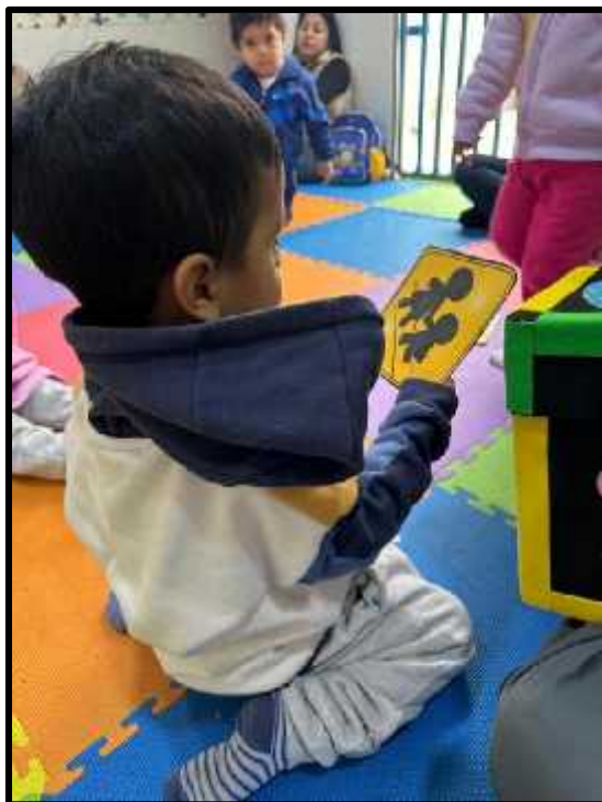
Imagen 25: Los estudiantes conociendo sobre las señales de tránsito.