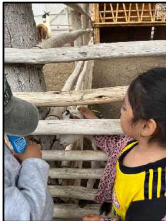
Imagen 61: Los estudiantes conociendo a los chivos.