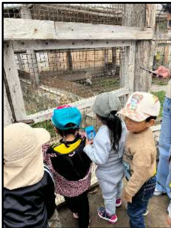
Imagen 60: Los estudiantes visitando la granja de nuestra comunidad