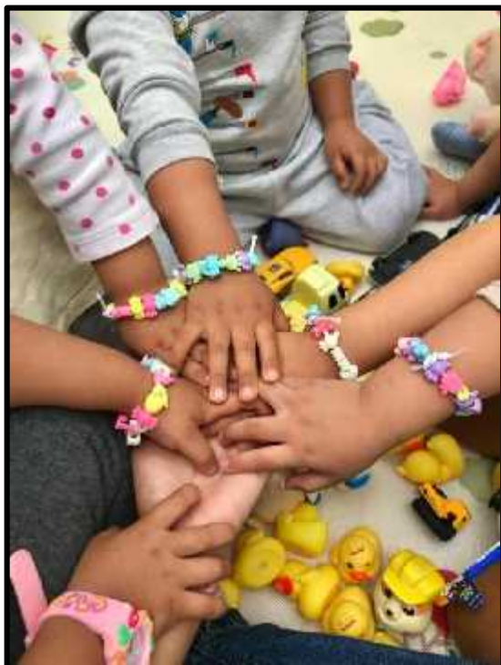
Imagen 7: Los estudiantes con sus pulseras hechas por ellos mismos.