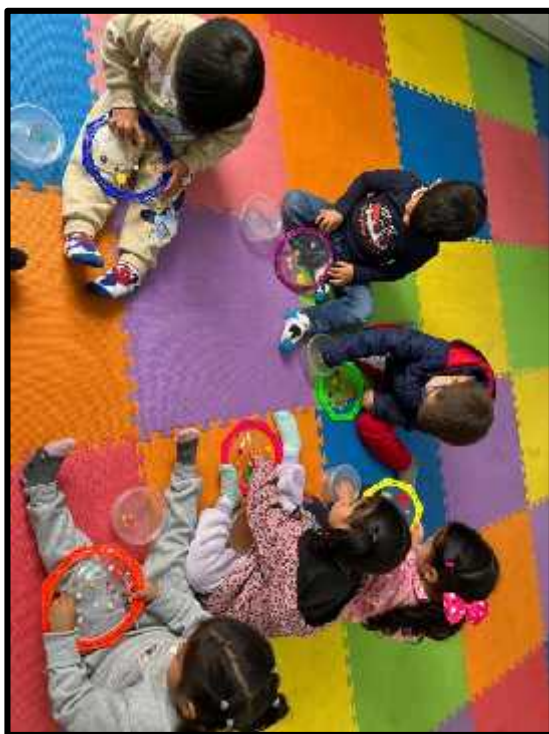
Imagen 50: Los estudiantes realizando su actividad motriz fina.