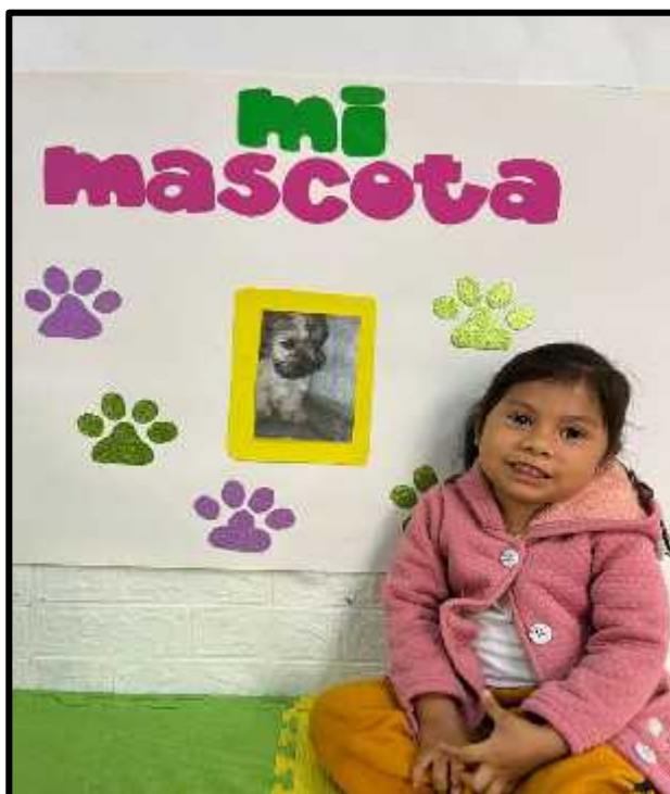
Imagen 34: Los estudiantes exponiendo sobre sus mascotas.