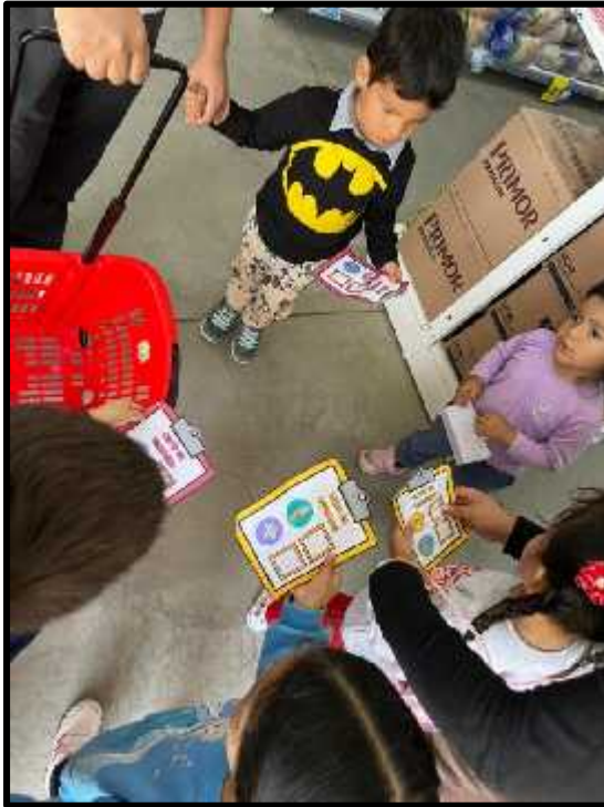
Imagen 40: Los estudiantes abejas visitando “Tiendas Mass”, con su lista y dinero.

- “Visitamos el supermercado y el mercado”