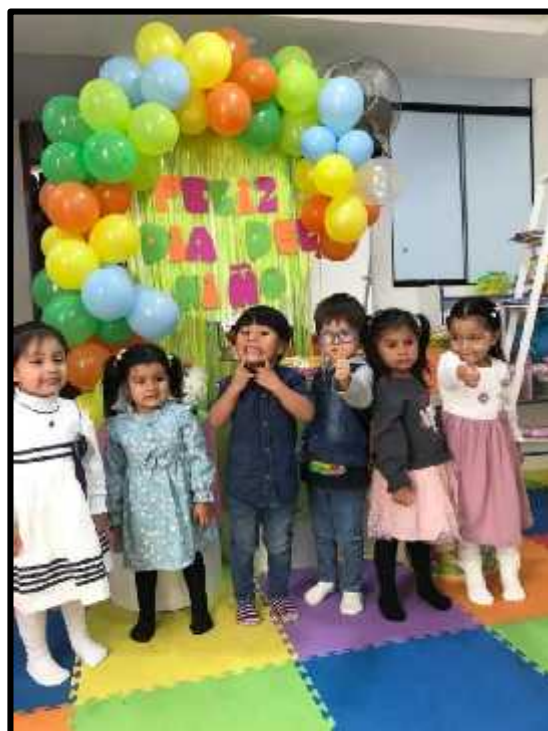
Imagen 12: Los estudiantes celebrando un día especial.