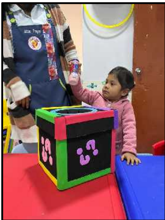
Imagen 36: Conociendo los diversos productos que hay en una tienda.