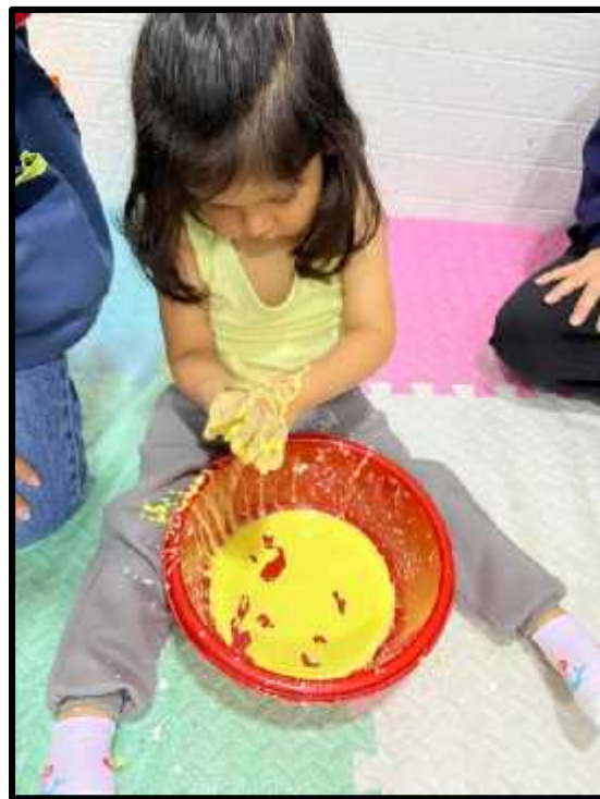
Imagen 51: Los estudiantes realizando el experimento “Flujo Newtoniano”