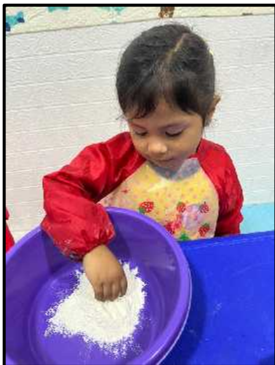
Imagen 66: Los estudiantes preparando sus picarones.