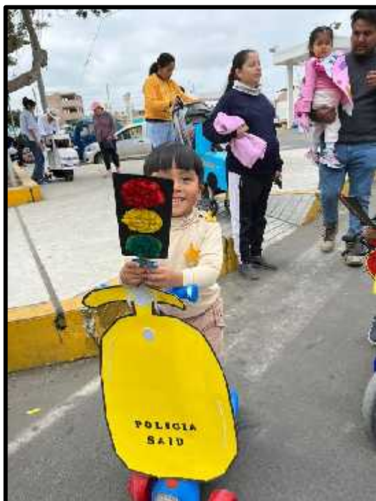
Imagen 27: Los estudiantes realizando su pasacalle.