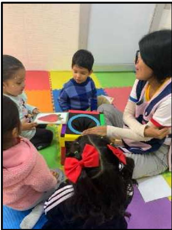
Imagen 1: Los estudiantes descubriendo diversas frutas con nuestros bits.