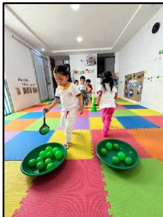
Imagen 20: Los estudiantes realizando su circuito motor.