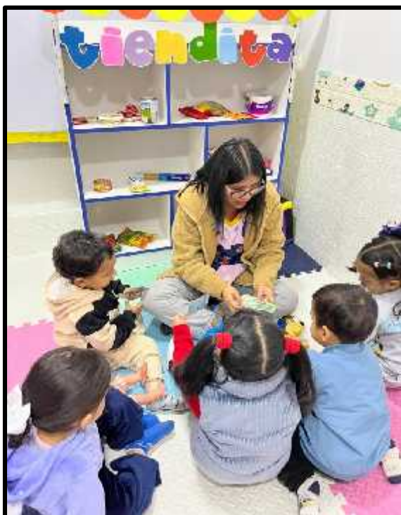
Imagen 38: Los estudiantes conociendo las monedas y billetes del Perú.