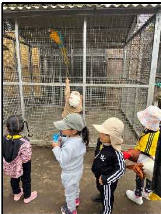
Imagen 62: Los estudiantes, conociendo el cuidado de los animalitos que viven allí.