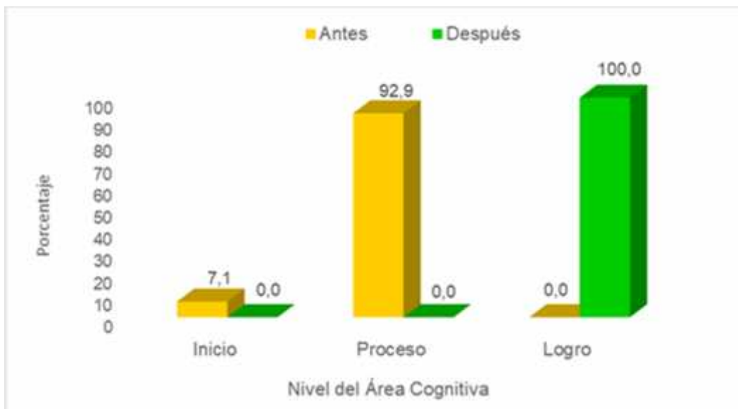
Figura 3: Resultados del pre y post test del área cognitiva.

Nivel del área cognitiva antes y después de aplicar las actividades de Estimulación Temprana “Pukllastil” en niños menores de 3 años en el CET “Huallitas”.