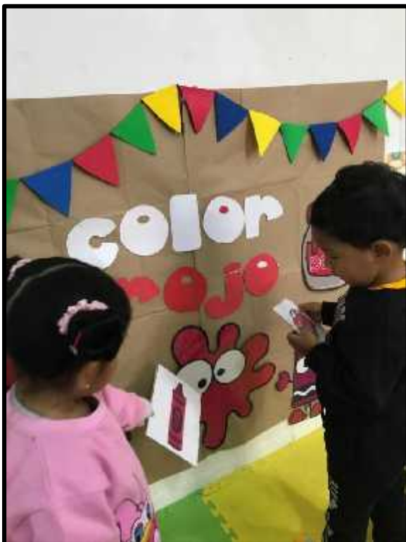
Imagen 13: Los estudiantes relacionando y compartiendo sus imágenes de color rojo.