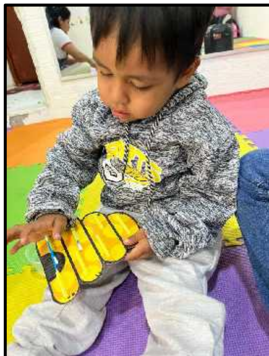
Imagen 49: Ensartando hisopos en el panal de abejas.