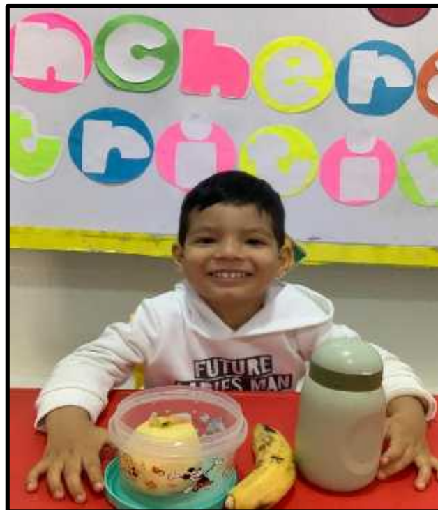
Imagen 6: Los estudiantes conociendo la importancia de comer alimentos saludables.