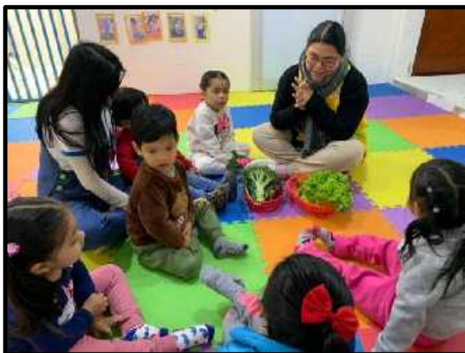
Imagen 3: Los estudiantes descubriendo diversas verduras reales.