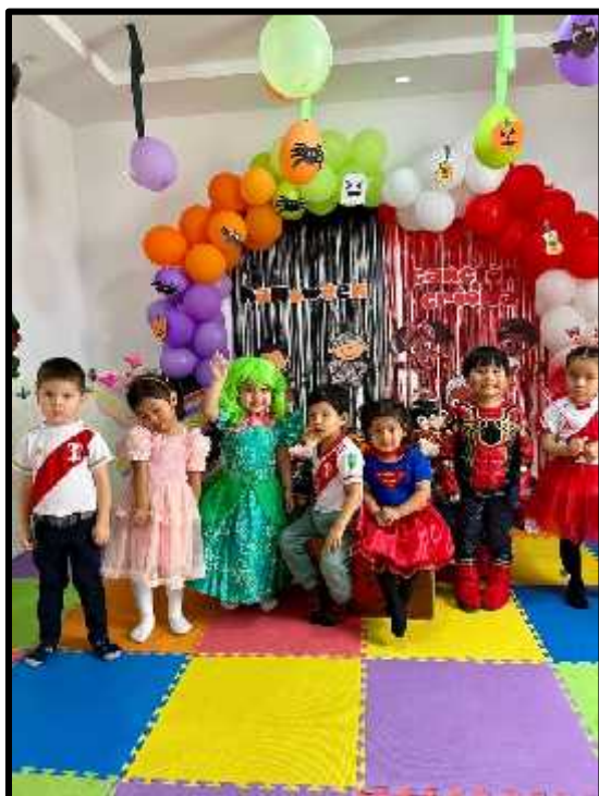
Imagen 74: Los estudiantes abejitas, celebrando nuestra fiesta de disfraces.