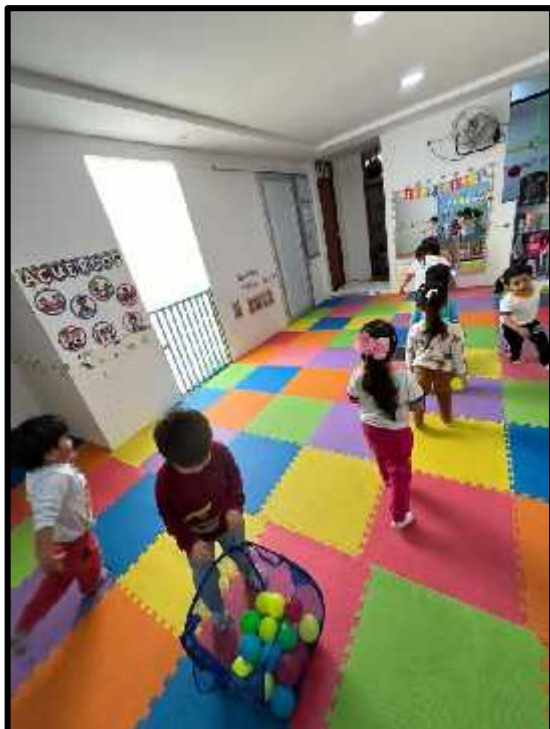
Imagen 48: Los estudiantes realizando el circuito motor.