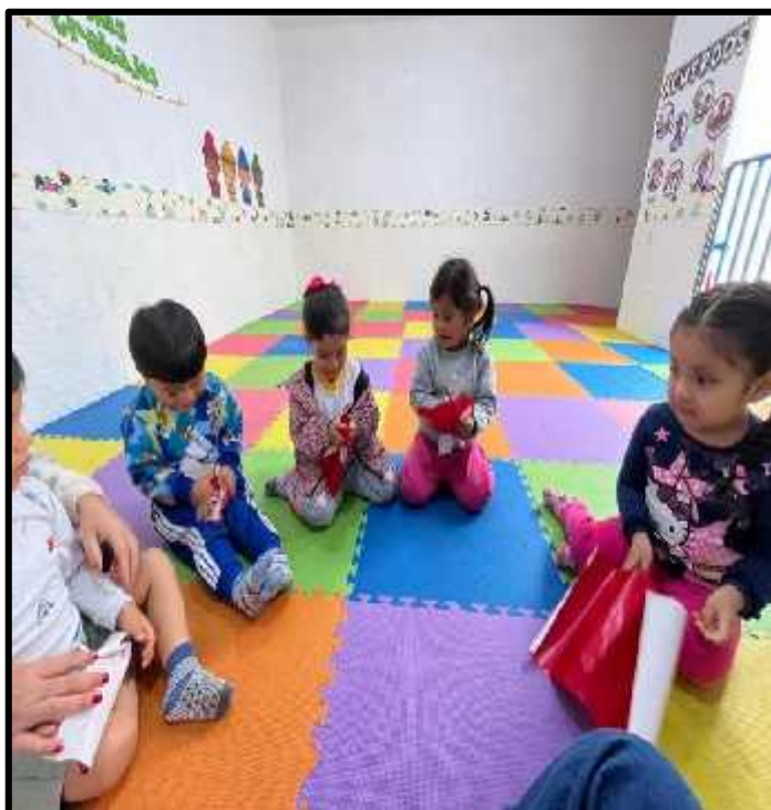
Imagen 54: Los estudiantes arrugando su papel lustre.