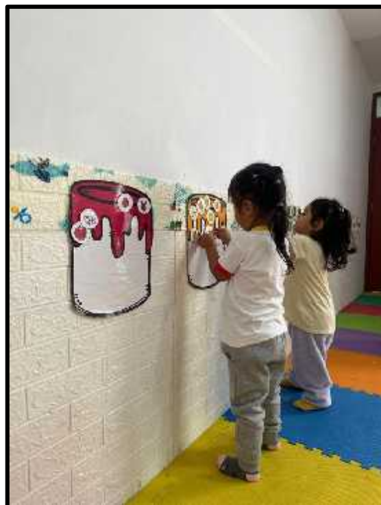
Imagen 22: Los estudiantes clasificando sus imágenes de colores con el color del tarro.