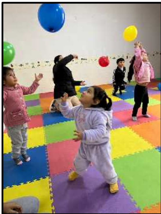
Imagen 21: Los estudiantes jugando libremente con nuestros globos de colores.