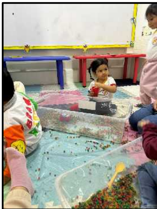
Imagen 37: Los estudiantes explorando libremente nuestros fideos de colores.