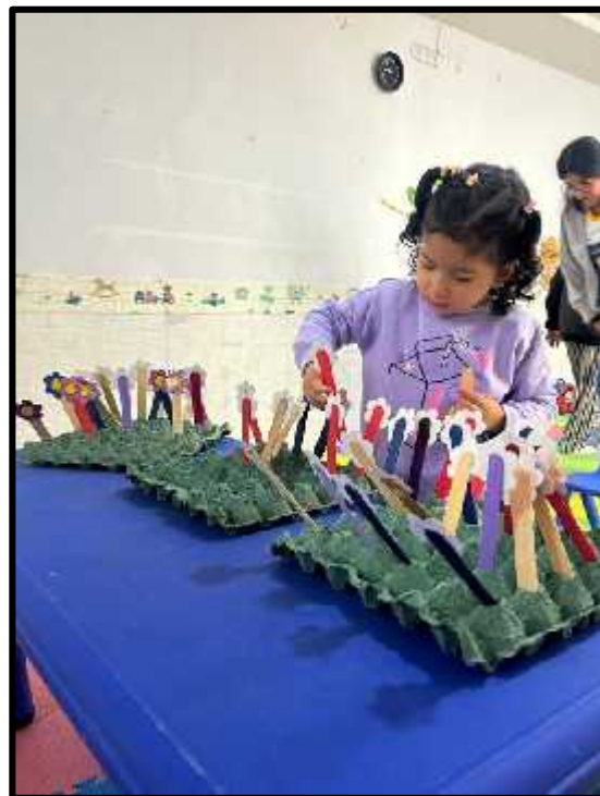
Imagen 47: Los estudiantes insertando sus flores.