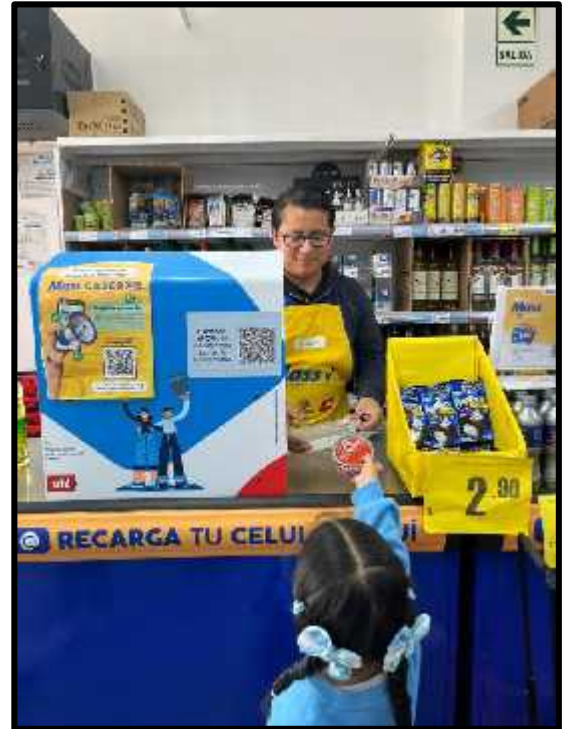
Imagen 41: Los estudiantes pagando su producto seleccionado