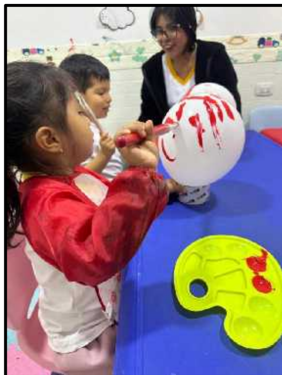
Imagen 14: Los estudiantes coloreando con tempera roja su globo blanco.