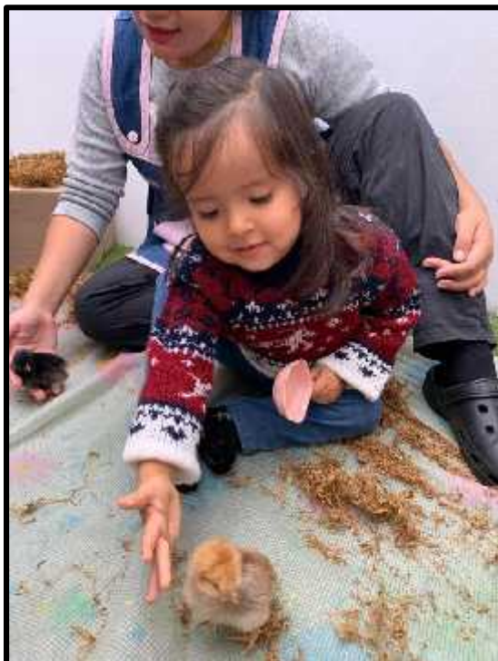
Imagen 56: Los estudiantes recibiendo la visita de nuestros pollitos.