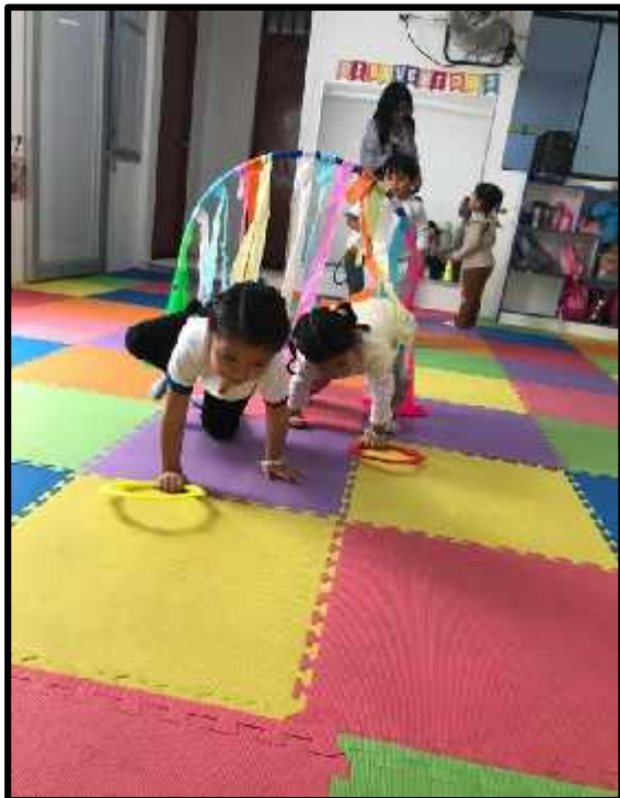
Imagen 9: Los estudiantes realizando el circuito motor.