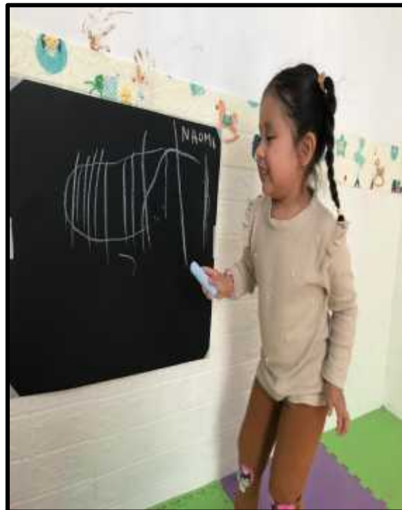
Imagen 10: Los estudiantes dibujando sus trazos con tiza jumbo.