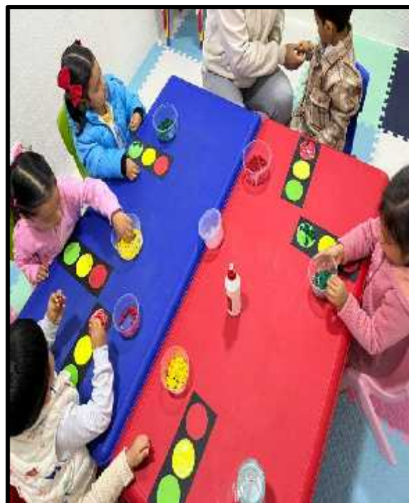
Imagen 24: Los estudiantes pegando bolitas de crepe en nuestro semáforo según su color.