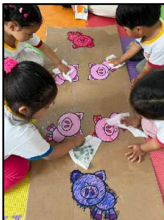
Imagen 58: Los estudiantes limpiando a los cerditos que están sucios.