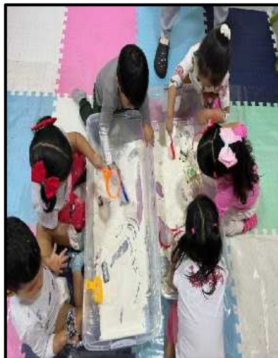
Imagen 26: Los estudiantes explorando libremente la harina con sus carritos de juguete.