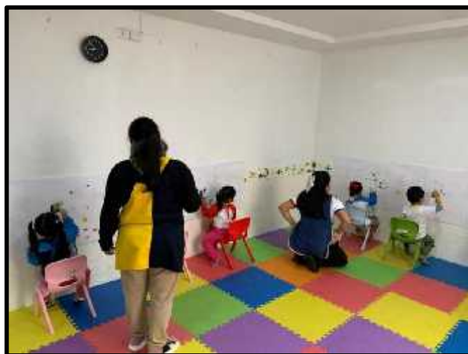
Imagen 4: Los estudiantes realizando estampado de verduras.