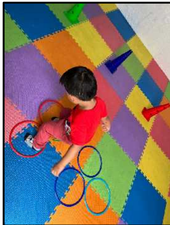
Imagen 55: Los estudiantes realizando su circuito.