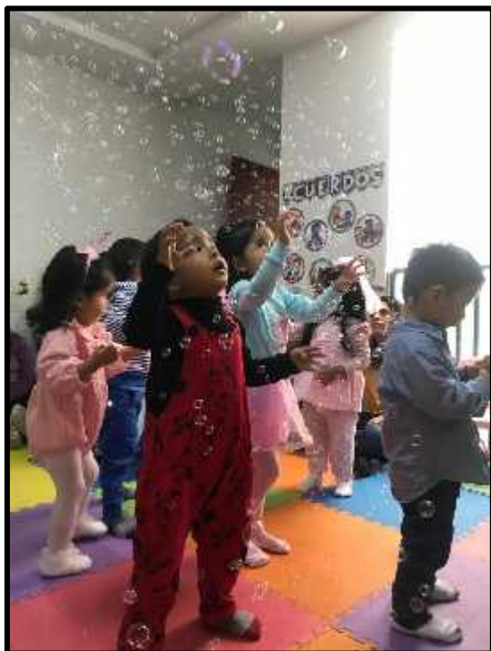
Imagen 11: Los estudiantes disfrutando del show de burbujas.