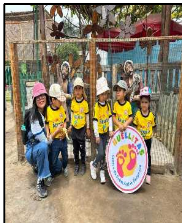
Imagen 63: Los estudiantes participes de la actividad.