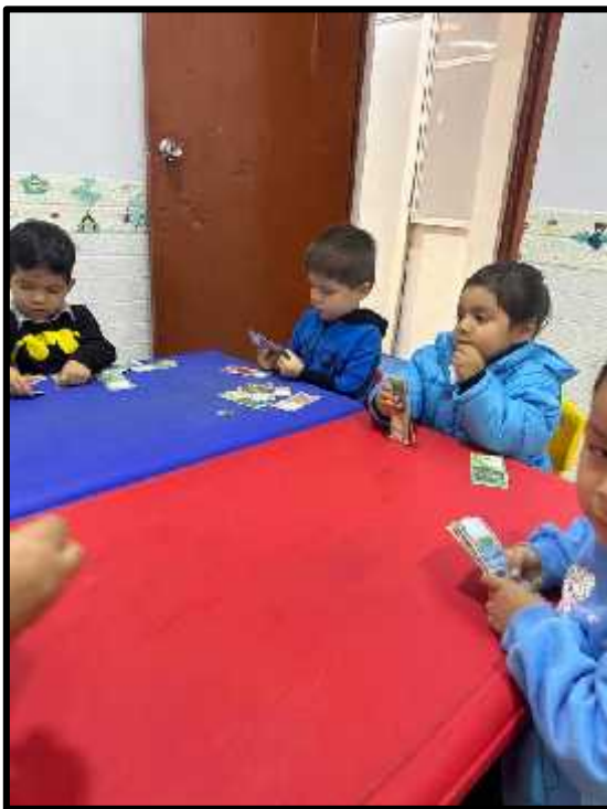
Imagen 39: Los estudiantes dialogando sobre lo que comprarán en la tienda.