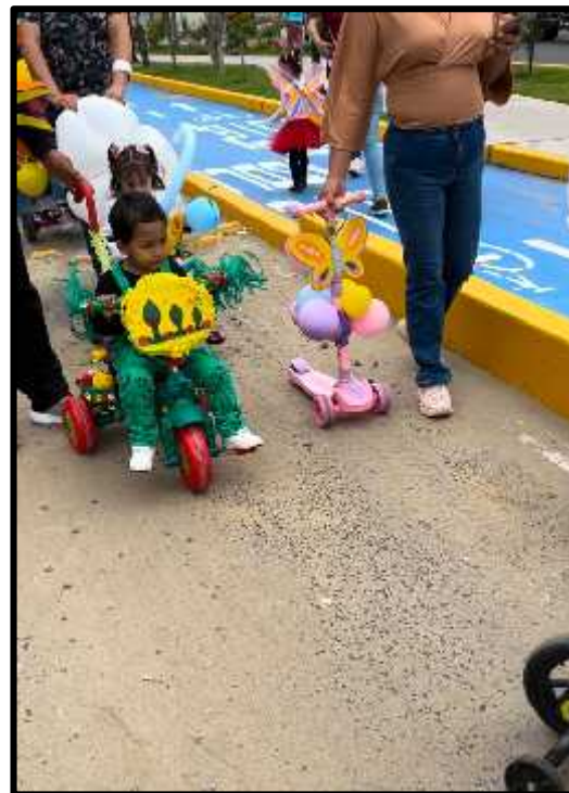
Imagen 45: Los estudiantes participando el curso de la primavera.