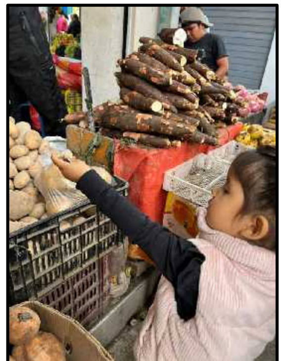
Imagen 43: Los estudiantes comprando sus productos.