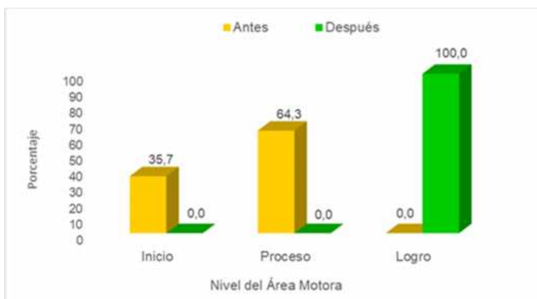
Figura 2: Resultados del pre y post test del área motora.

Nivel del área motora antes y después de aplicar las actividades de Estimulación Temprana “Pukllastil” en niños menores de 3 años en el CET “Huellitas”.