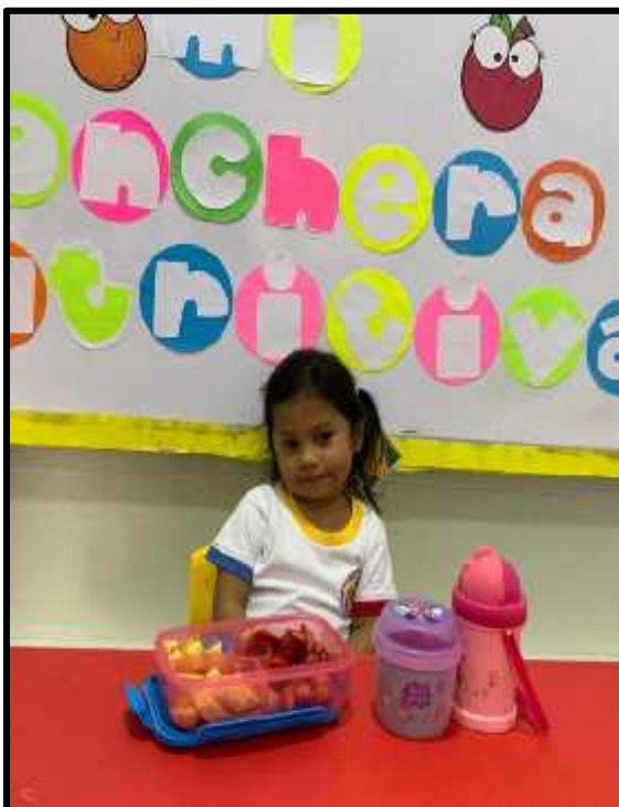
Imagen 5: Los estudiantes exponiendo sobre su lonchera saludable.