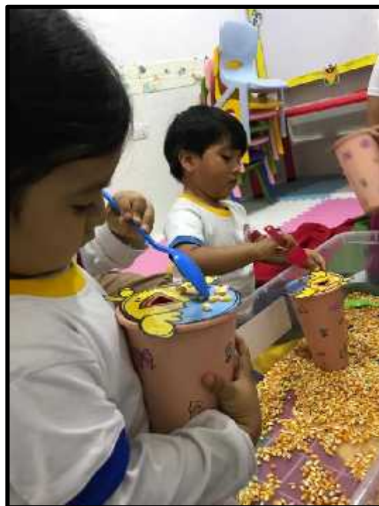
Imagen 4: Los estudiantes dando de comer maíz a su pollito de color amarillo.