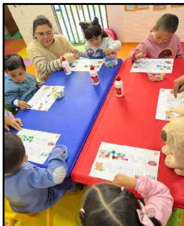
Imagen 35: Los estudiantes realizando su hoja de trabajo.