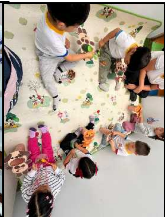
Imagen 31: Los estudiantes conociendo la comida que comen nuestras mascotas.