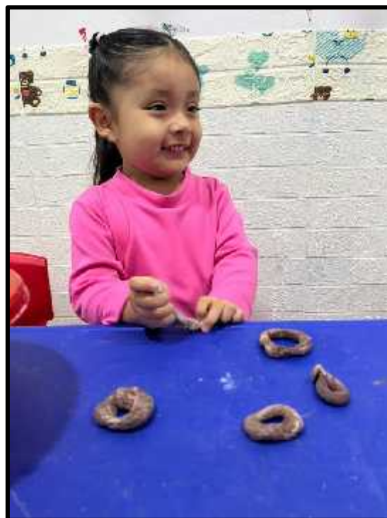
Imagen 67: Los estudiantes dándole forma a sus picarones.