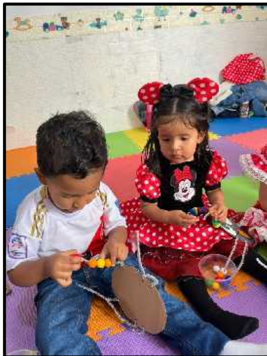
Imagen 68: Los estudiantes ensartando cuentas en la araña.