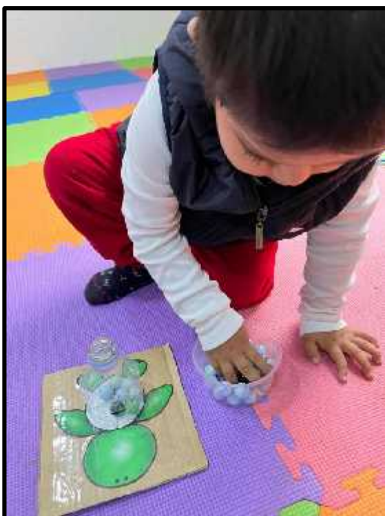
Imagen 19: Los estudiantes insertando bolitas en nuestra tortuga verde.