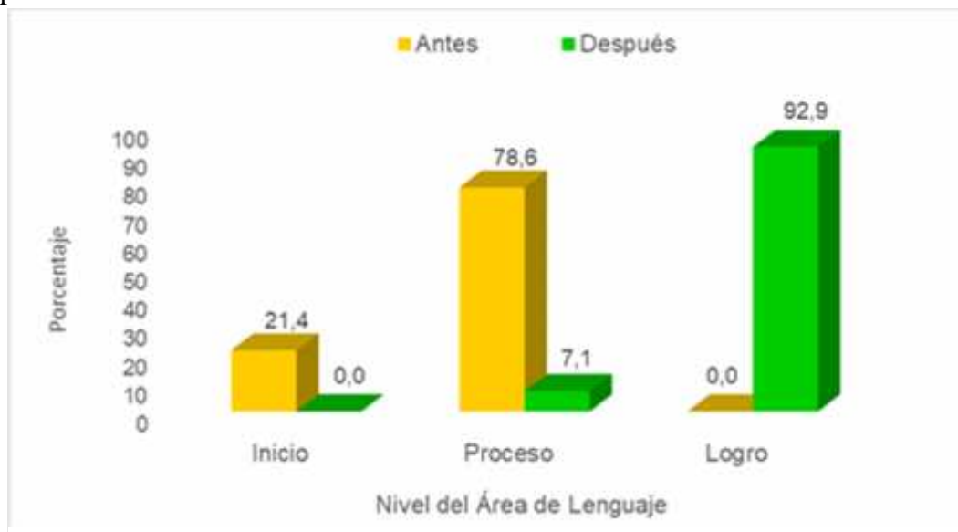
Figura 1: Resultados del pre y post test del área de lenguaje.

Nivel del área de lenguaje antes y después de aplicar las Actividades de estimulación temprana “Pukllastil” en niños menores de 3 años en el CET “Huellitas”.