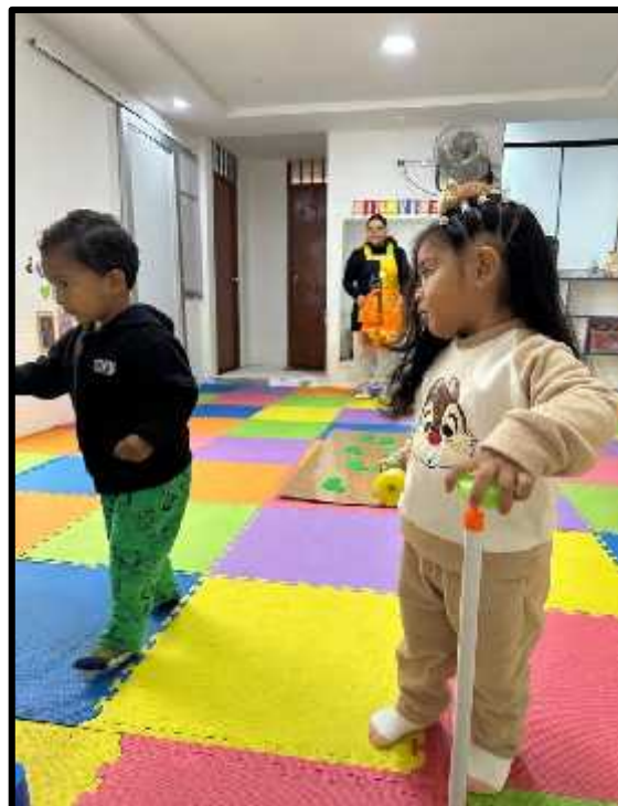
Imagen 8: Los estudiantes realizando su circuito motor.