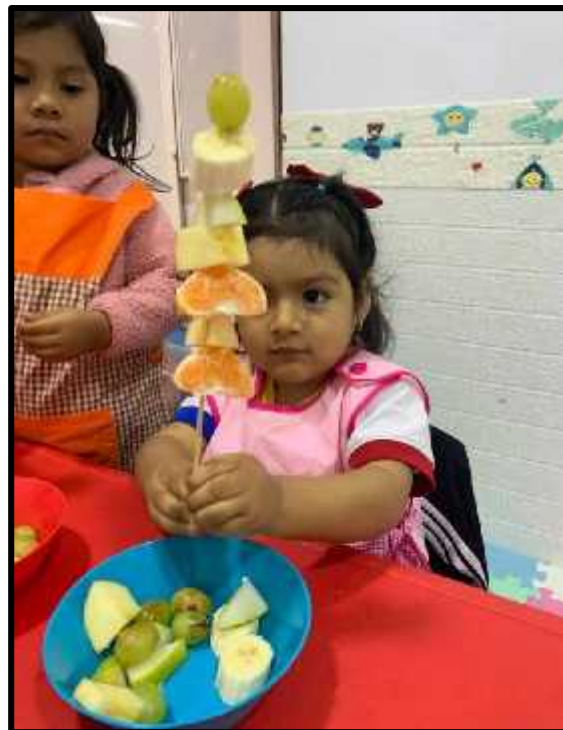
Imagen 2: Los estudiantes realizando su brocheta de frutas.