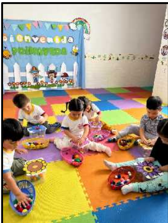
Imagen 44: Los estudiantes insertando pompones en su flor.