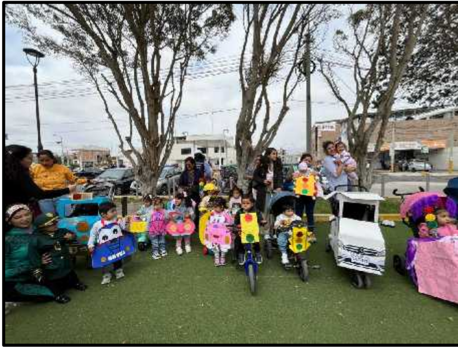
Imagen 29: Participación de los padres de familia en nuestro pasacalle.