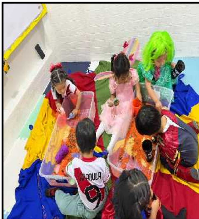
Imagen 65: Los estudiantes explorando libremente nuestra actividad sensorial.