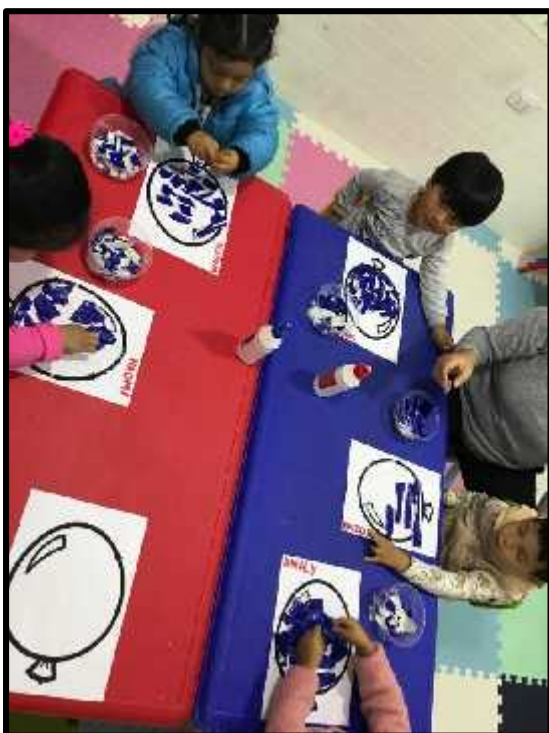
Imagen 15: Los estudiantes pegando sus trozos de papel lustre azul, troceados por ellos mismos.