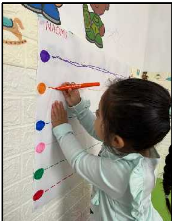
Imagen 52: Los estudiantes realizando su trazo.