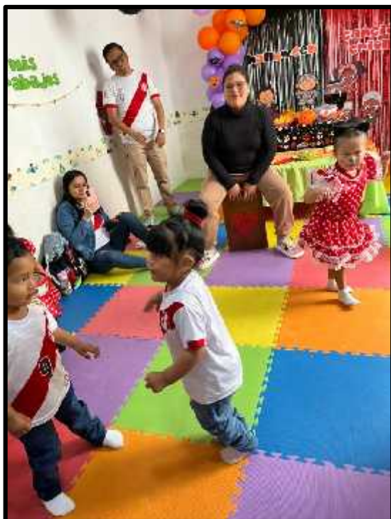
Imagen 72: Los estudiantes detectives festejando con música criolla.