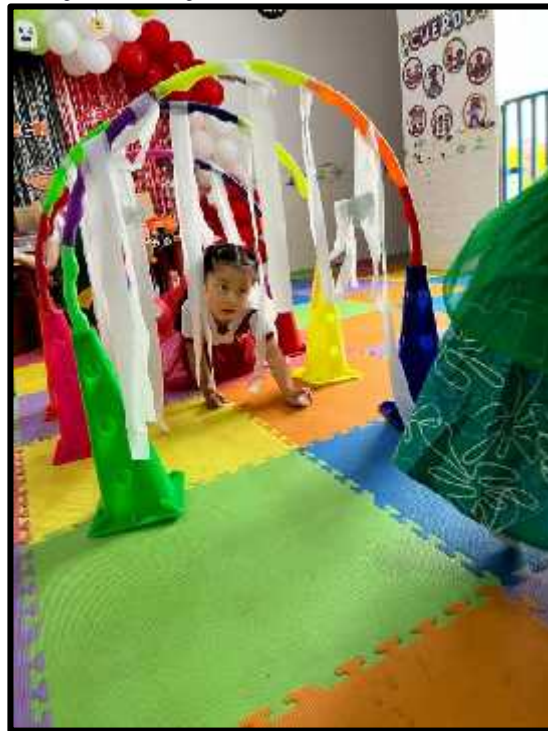
Imagen 75: Los estudiantes realizando su circuito motor.