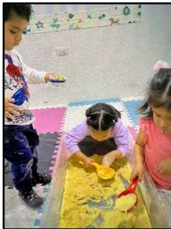
Imagen 59: Los estudiantes explorando la polenta.