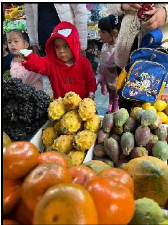
Imagen 42: Los estudiantes detectives visitando el mercado “Buenos Aires”, con su lista y dinero.