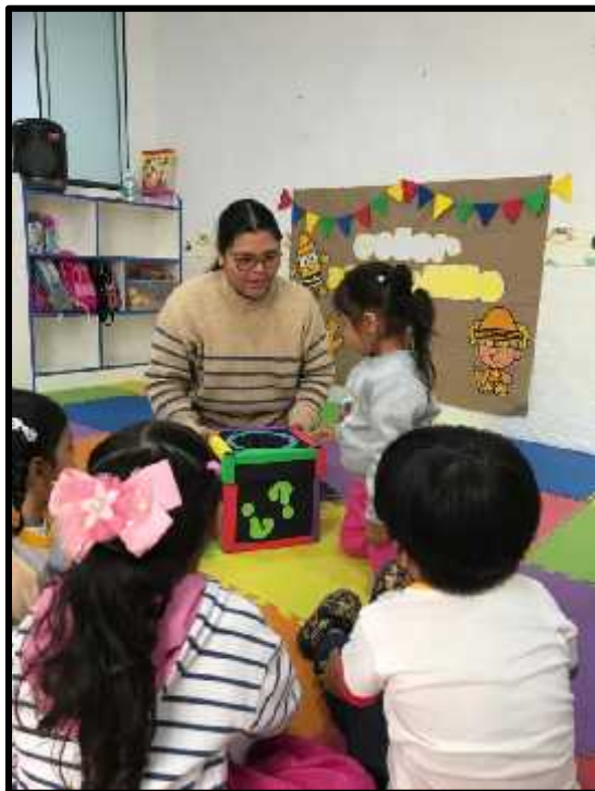
Imagen 3: Los estudiantes atentos a conocer los objetos que hay dentro de nuestra caja sorpresa.