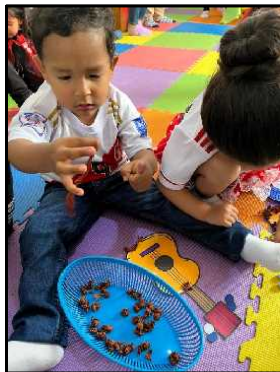
Imagen 71: Los estudiantes realizando su actividad gráfico – plástica.