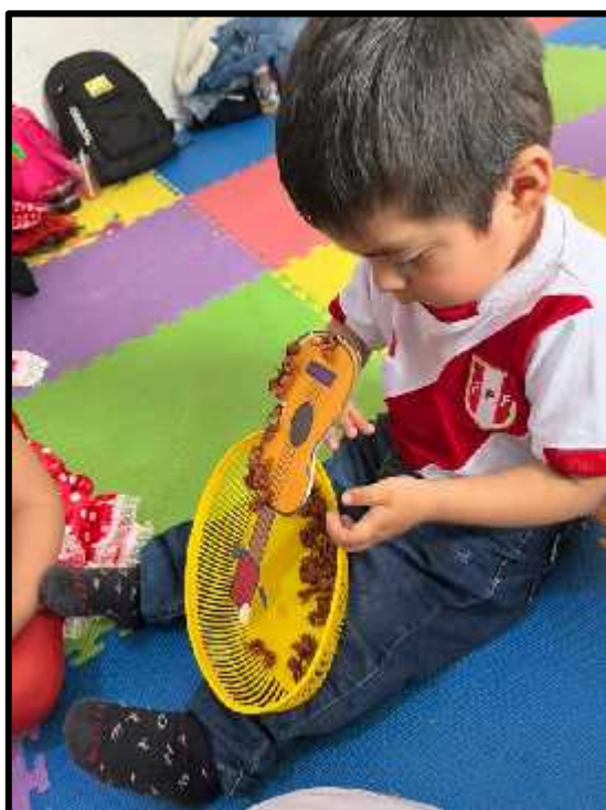
Imagen 70: Los estudiantes, conociendo un instrumento musical criollo.