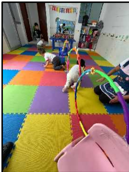
Imagen 46: Los estudiantes realizando su circuito motor.