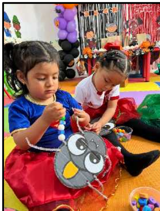
Imagen 69: Los estudiantes realizando su actividad motriz fina.