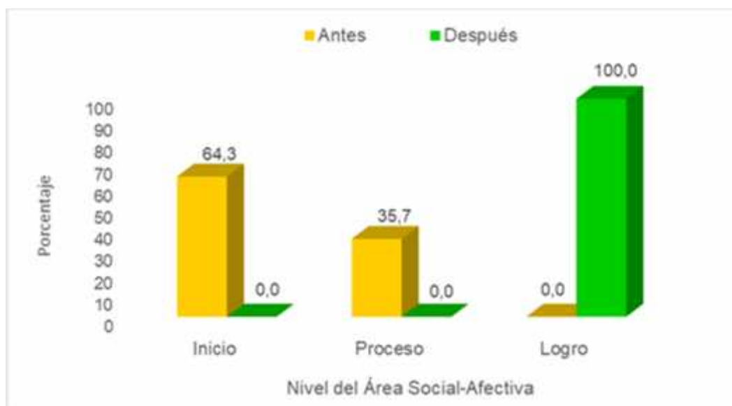
Figura 4: Resultados del pre y post test del área Social - Afectiva.

Nivel del área social - afectiva antes y después de aplicar las actividades de Estimulación Temprana “Pukllastil” en niños menores de 3 años en el CET “Huellitas”.