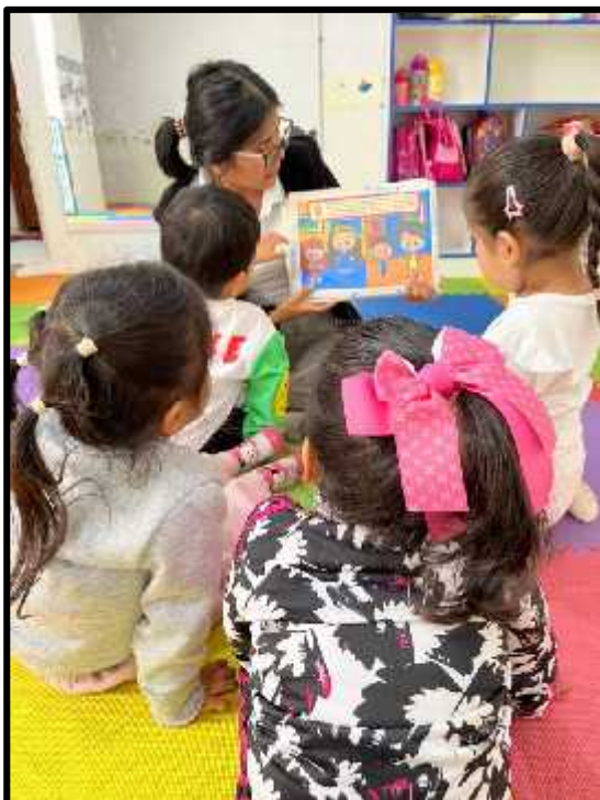
Imagen 23: Los estudiantes escuchando atentamente el cuento sobre la “Educación Vial”.