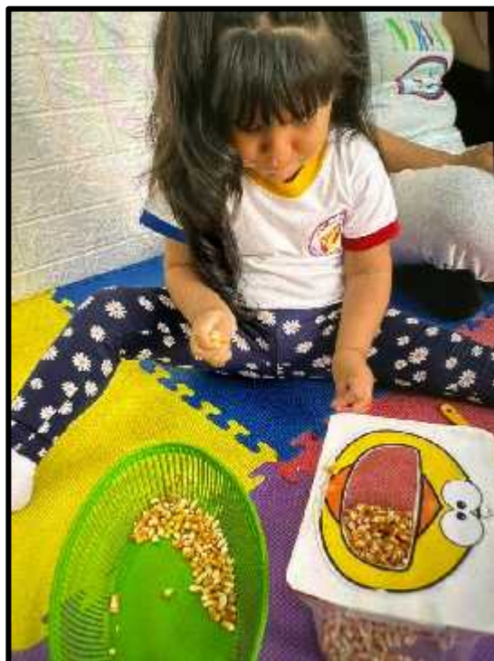
Imagen 57: Los estudiantes dándole de comer maíz a nuestros animalitos.