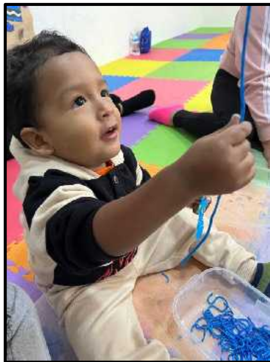
Imagen 16: Los estudiantes explorando libremente los fideos sensoriales sancochados de color azul.