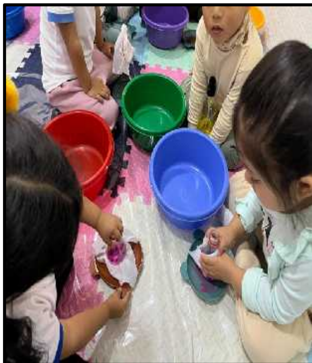
Imagen 53: Los estudiantes realizando su experimento “Arcoíris de burbujas”