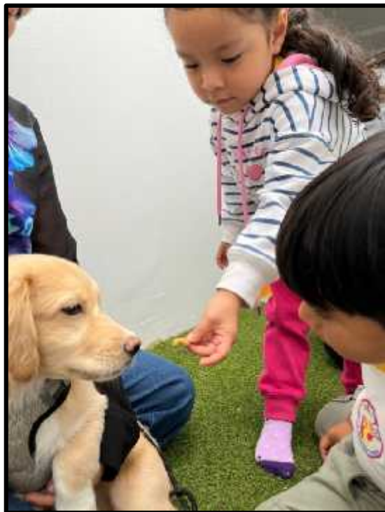
Imagen 32: Los estudiantes del grupo abejas tienen la visita de Dember.