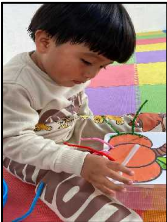
Imagen 64: Los estudiantes realizando su actividad de motricidad fina.